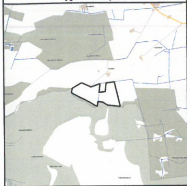
Žemės sklypo išdėstymo schema